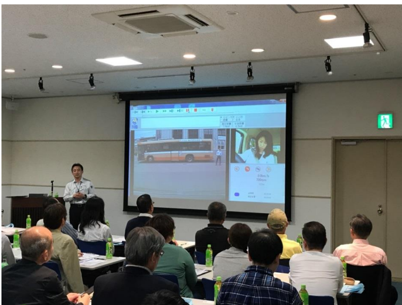
運転ぶりビデオ診断ふりかえり