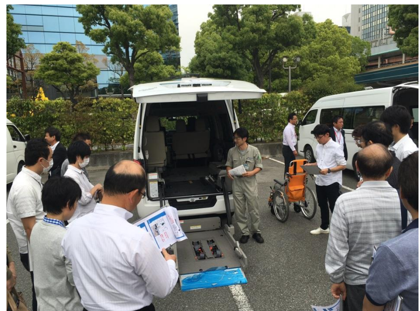
福祉車両の架装装置トラブル時の緊急対応