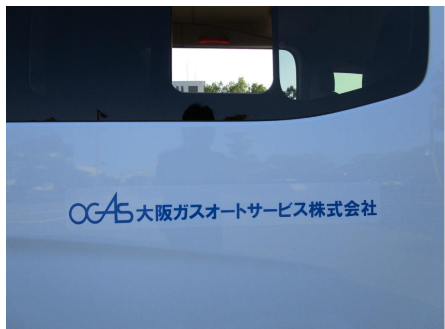
今回より社名を車体に貼り OGAS アピール