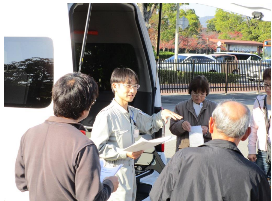
毎回好評の福祉車両の扱い方実演