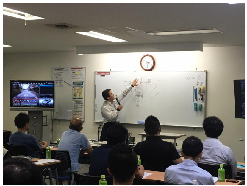
自身の運転をふりかえる運転ぶりビデオ診断