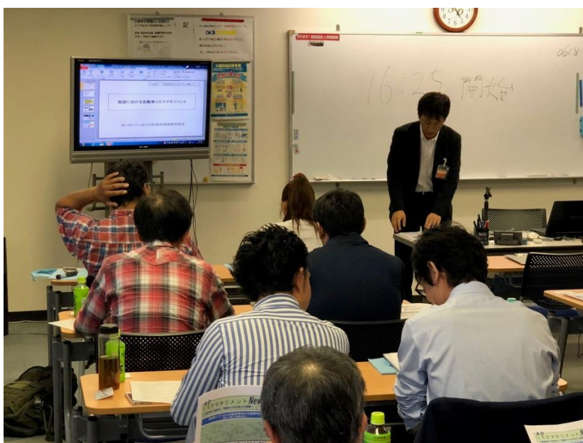
福祉業界特有の事故事例なども紹介