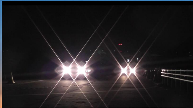
夜間における錯覚